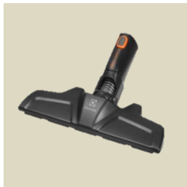
Flexibilní hubice ZE112 FlexPro™ Pro čištění hůře dostupných oblastí