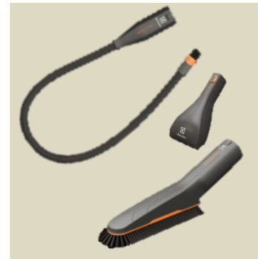
Sada KIT12 AeroPro™ Clean & Tidy Sada nástrojů: 1× kartáč MiniTurbo, 1× štěrbinový nástroj, 1× nástroj na chloustivé povrchy