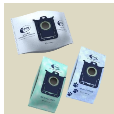
Prachový sáček E210S S-bag® s extra dlouhou životností Prachový sáček E206S S-bag® antialergenní Prachový sáček E203S S-bag® s potlačováním zápachu