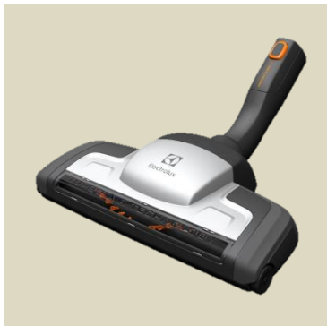
Hubice s turbokartáčem ZE114 Pro všechny typy podlah a koberců