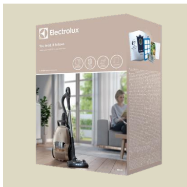
Sada ESKD9 Performance

4× prachové sáčky S-bag® s extra dlouhou životností, 1× filtr S-filter®, 4× kapsle S-fresh™, 1× osvěžovač Citrus Burst, 1× filtr motoru